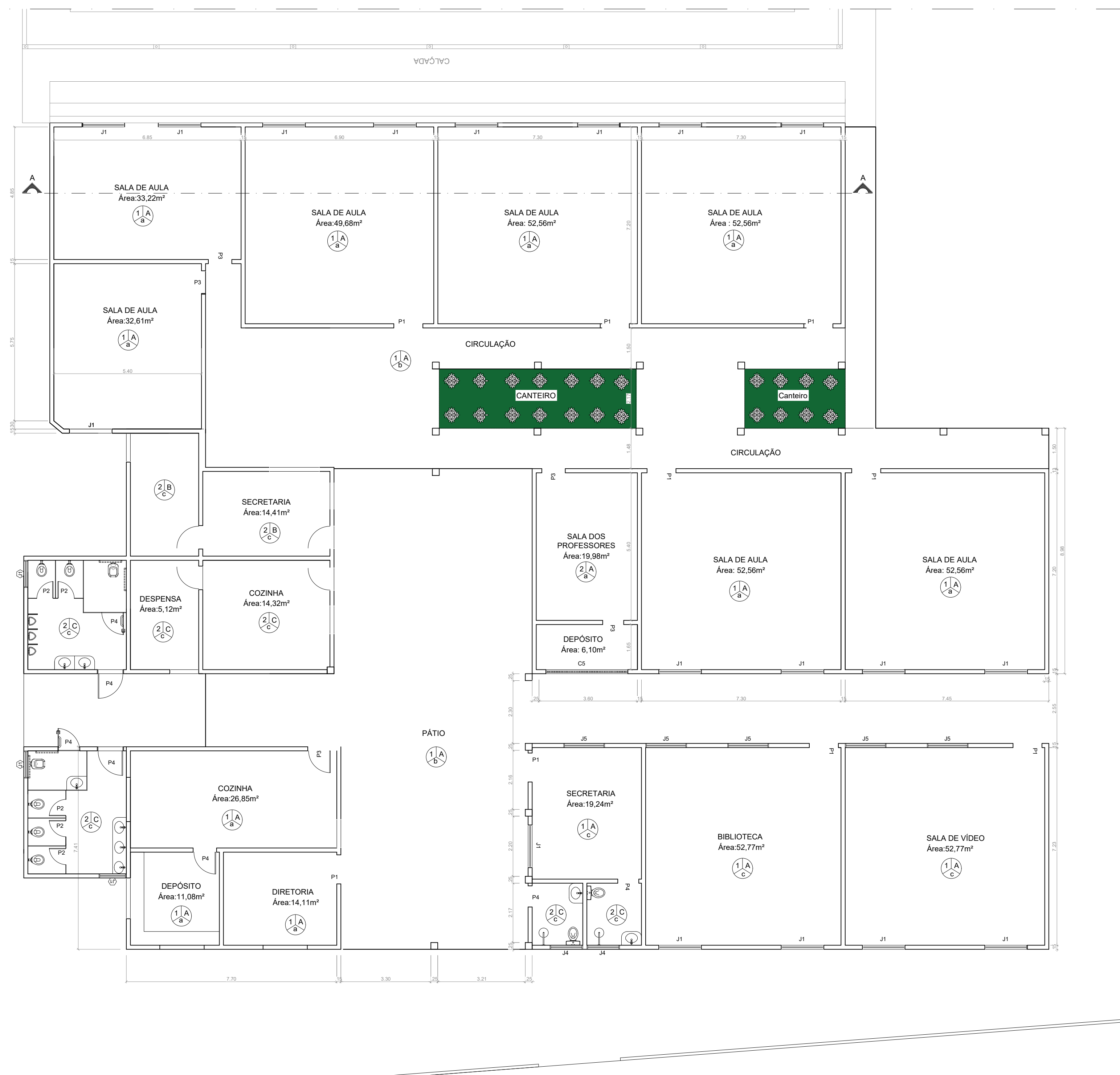
PLANTA BAIXA ESCALA-----1/100